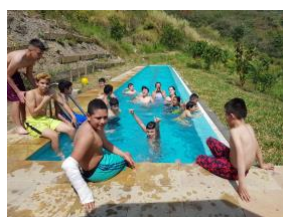
Viaje a Choachí