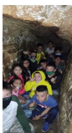
Piedras de Suesca